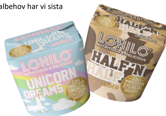
Två nya glassmaker från Lohilo Foods; Unicorn Dreams och Half 'n Half