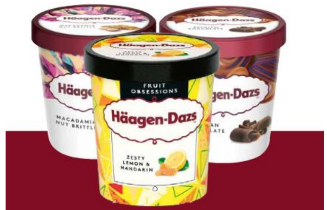
Utvalda smaker från Häagen Dazs. Vårens stora nyhet Zesty Lemon & Mandarin i front.

Riktad nyemission 10 MSEK till Santhe Dahl Invest.